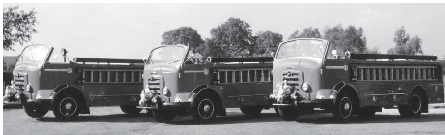
Afb. 17: in 1958 koos Alkmaar nog voor 'open'.