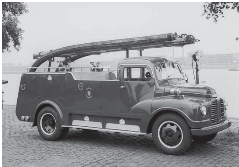
Boven van links naar rechts: Afb. 2: Langsbanken, afb. 3: Autospuit van Van der Ploeg en afb. 4: Langsbanken en zijhekken.

Was aanvankelijk de voorruit alleen nog maar bij de bestuurder aangebracht, al snel werd deze ruit vergroot en benut om alle op de voorbank gezeten mensen enige