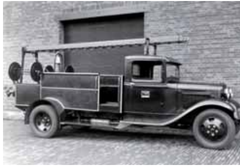
Links: Afb. 12: Let op de hand- bediende richting- aanwijzer!