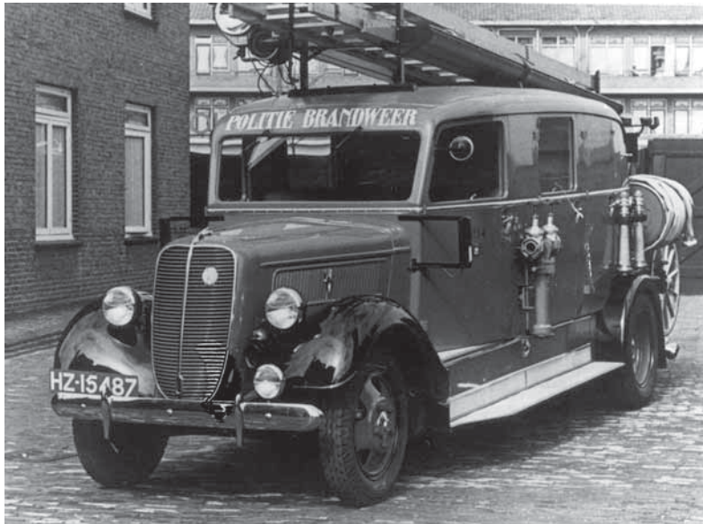
Rechtsboven: Afb. 13: Autospuit met 'chauffeurcabine'. Midden: Afb. 14: Fraai gevormde autospuit van Den Haag (1937)

leveren met een gesloten cabine voor de chauffeur en bijrijder. Door de Nederlandse brandspuitfabrikanten is hier dankbaar gebruik van gemaakt en vanaf 1930 zien wij dan ook steeds meer autospuiten met een 'chauffeurscabine' verschijnen. (Afb. 13.) Haast wel zeker is het eerste brandweerkorps dat zich in geheel 'gesloten' vorm naar de brand begaf de brandweer van Den Haag