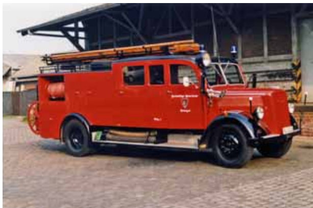
Midden: Afb. 9: Gesloten Somua Brandweer Parijs begin jaren dertig. Rechts: Afb. 10: Na de eerste gesloten autospuit in Berlijn (1930), leken de Duitse autospuiten lange tijd op dit type met lage achterbouw. Afb. 11: Engelse gesloten opbouw zonder portieren.

De snelheid, wendbaarheid en het remvermogen werden alsmaar groter en ook aan de veiligheid en het comfort werden steeds meer eisen gesteld. Bescherming tegen de weersinvloeden werd gevonden door het toepassen van een linnen kapconstructie die naar believen in de zomermaanden kon worden afgenomen. (Afb. 8.) Rond 1930 verschenen de eerste volledig gecarosseeerde autospuiten, beter bekend als de 'gesloten' autospuit. Parijs had hiermede de primeur. De indrukwekkende Somua's en Delahayes zagen er ineens uit als autobussen (afb. 9) maar met de tonen van de toen al in dat land zo