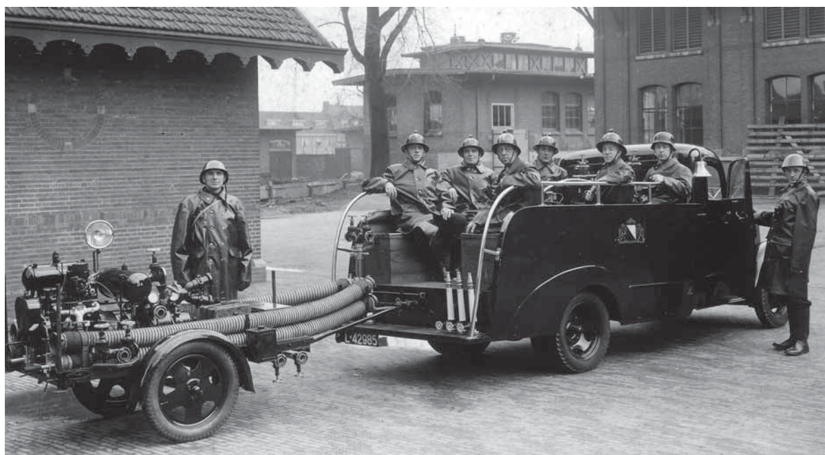
Midden: Afb. 5: Dwarsbanken met portieren. Rechts: Afb. 6: Naar binnen gerichte langsbanken.