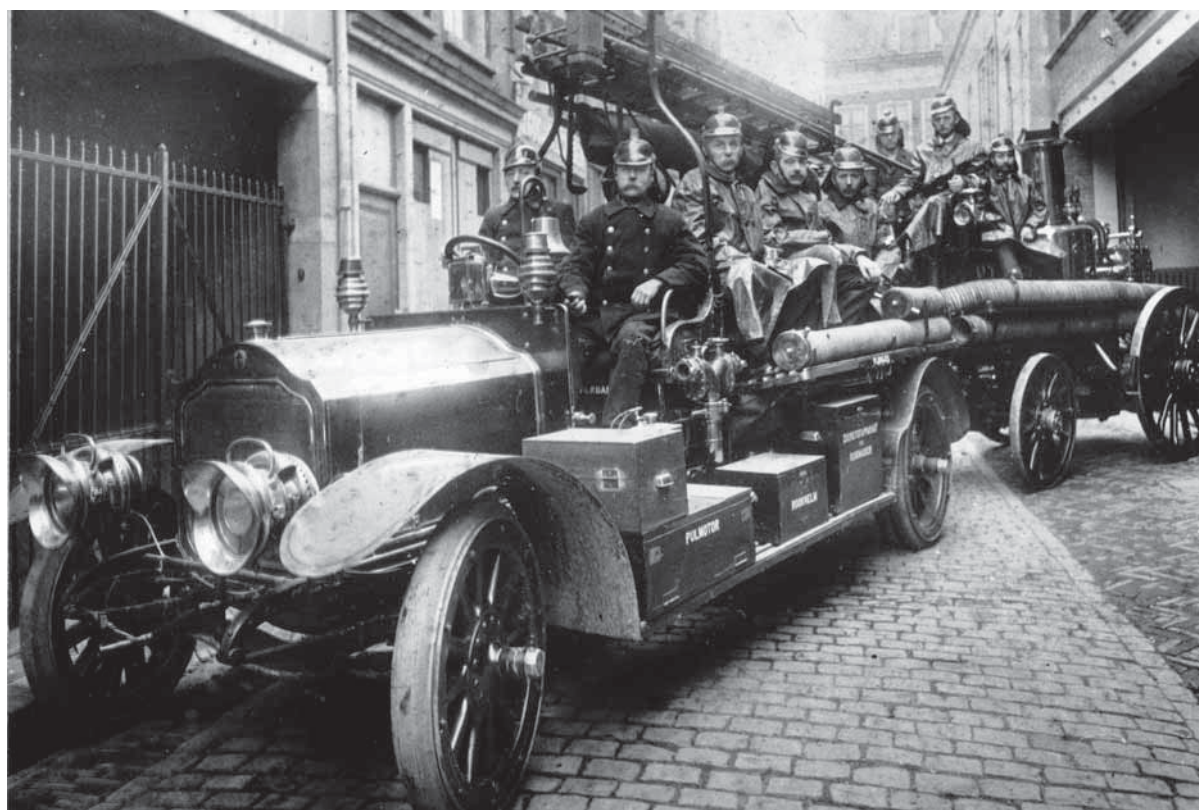
De tweede auto-spuit, eveneens een Lorraine-Dietrich/Drouville – in dienst sinds 1910 – uitrukkend met aangekoppelde stoomspuit vanuit de garage aan de Annastraat.

Het waren namelijk betaalde krachten, meestal voortgekomen uit de vrijwilligers van het korps, die naast hun eigen beroep één maal per vier dagen van 8 uur 's avonds tot 7 uur 's morgens