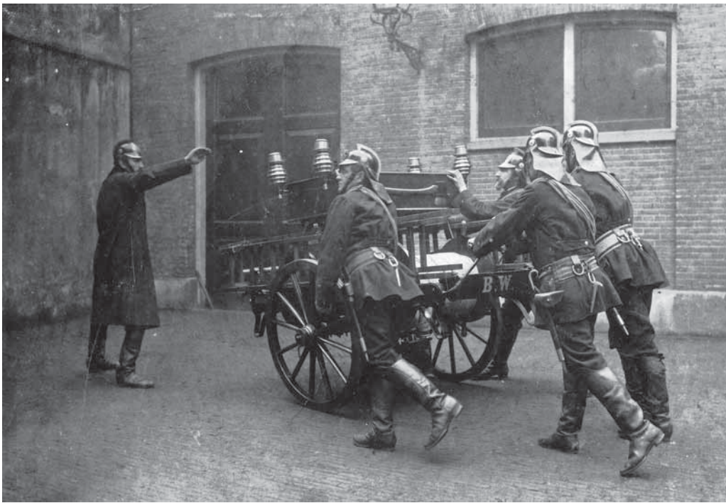
De slangenwagen van de 'vaste wacht', waarmee werd uitgerukt voor de indienststelling van de autospuit.

dienst deden/aanwezig waren in de hoofdwacht van de brandweer, die toen nog het 'Centraal Bureau' werd genoemd. Dit bureau was gevestigd in het voormalige stedelijk gymnasium aan de Minrebroederstraat, de werkplaatsen en onderkomen van het materieel in de daarachter gelegen Annastraat. Beide panden waren via een binnenplaats met elkaar verbonden.