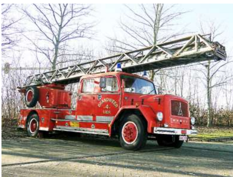
een oldtimer in de buitenlucht