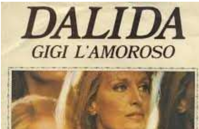
deel van een platenhoes

De tekst van Schele van der Linde in het lied van De Strangers is afgeleid van de tekst van Gigi l'Amoroso, waarvan ook de melodie is geleend.