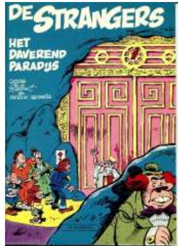
De Strangers in de jaren '70

Ze traden op voor de Antwerpse burgemeester en voor het Belgische koningspaar en zijn ooit in kort opspraak geraakt omdat ze optraden op een bijeenkomst van het Vlaams Blok. Ze hadden dat trouwens ook wel eens gedaan bij de CVP en bij de krant De Morgen.