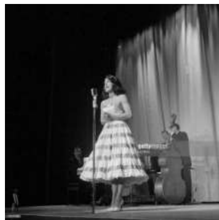
Dalida in de Olympia

Dalida was een Egyptisch – Franse zangeres, wier carrière moeizaam op gang kwam. Tot ze in aanraking kwam met een drietal artiesten die voor haar liedjes gingen schrijven. Gigi l'Amoroso werd eerst nog afgewezen door Dalida's manager, maar toe het was aangevuld met wat Italiaanse puntjes kon het worden uitgevoerd. Het werd een doorslaand succes. Op 15 januari 1974 stond Dalida in de Olympia in Parijs en "het dak ging eraf". Dalida kreeg de bijnaam "La Callas de Jukebox". Ook in Nederland werd het een enorm succes. In 1974 stond het op nummer 1.