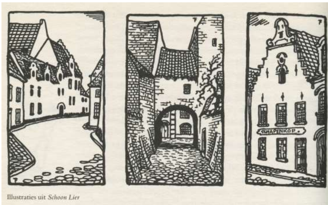
Illustraties uit Schoon Lier

Veel daar zal er in zijn tijd hebben uitgezien zoals Felix Timmermans het heeft afgebeeld: