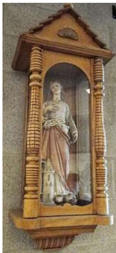
Sint Barbara in de kast