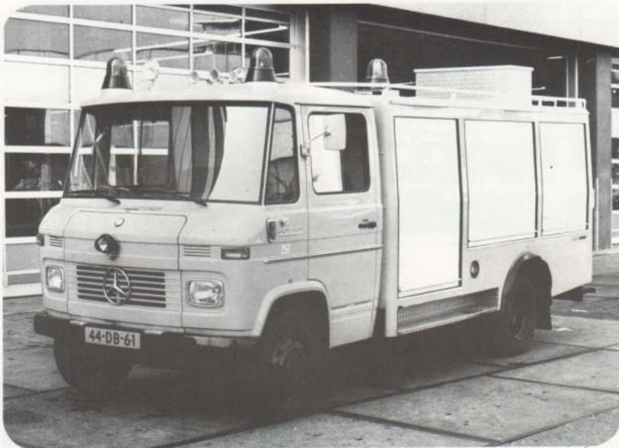
Opbouw Doeschot-Rosenbauer, Hippolytushoef